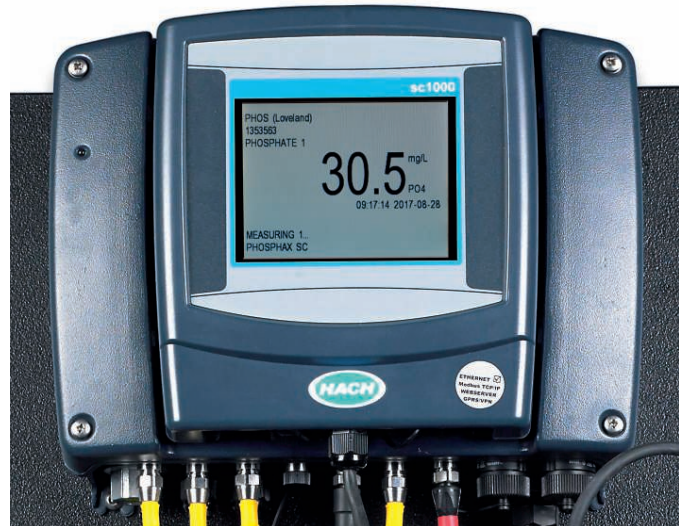
Afbeelding 4: voorbeeld van real-time gegevens voor Phosphax