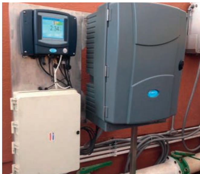
Afbeelding 2: voorbeeld van RTC-P-systeem